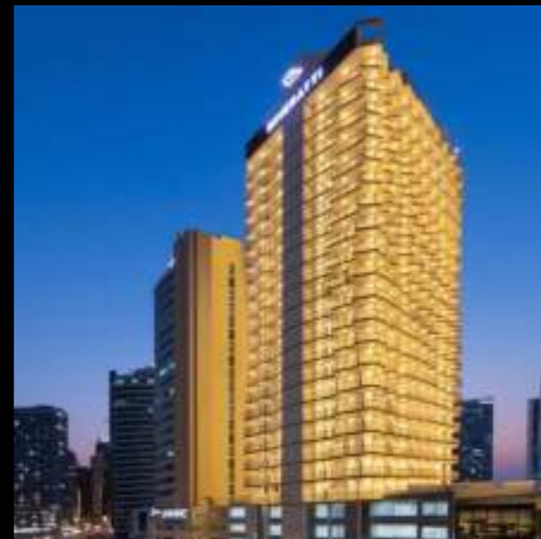
MILLENIUM BINGHATTI RESIDENCE