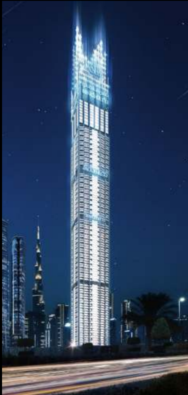
BURJ BINGHATTI JACOB & CO RESIDENCES