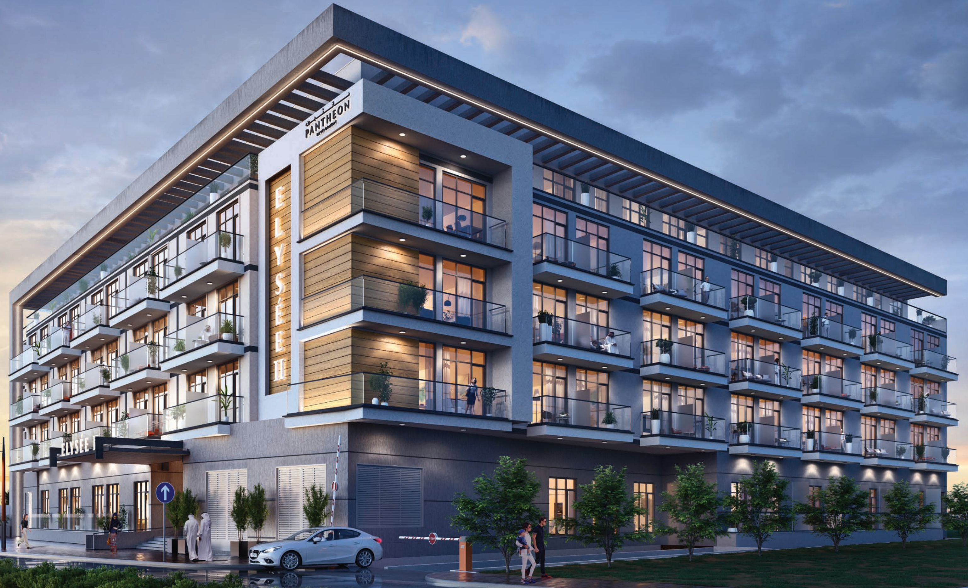
Pantheon Elysée II Location: District 13 (JVC)