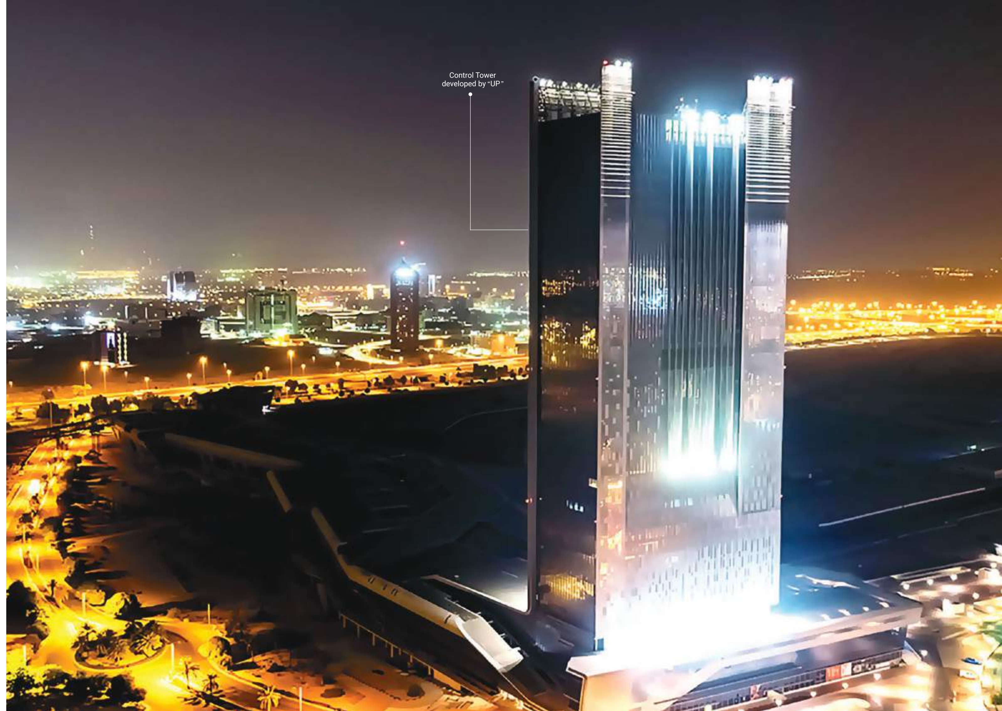
Control Tower developed by "UP"

يتضمن مشروع موتور سيتي عدداً من المرافق التعليمية الرائدة والمرموقة، بالإضافة إلى عدد من المستشفيات، العيادات والصيدليات.