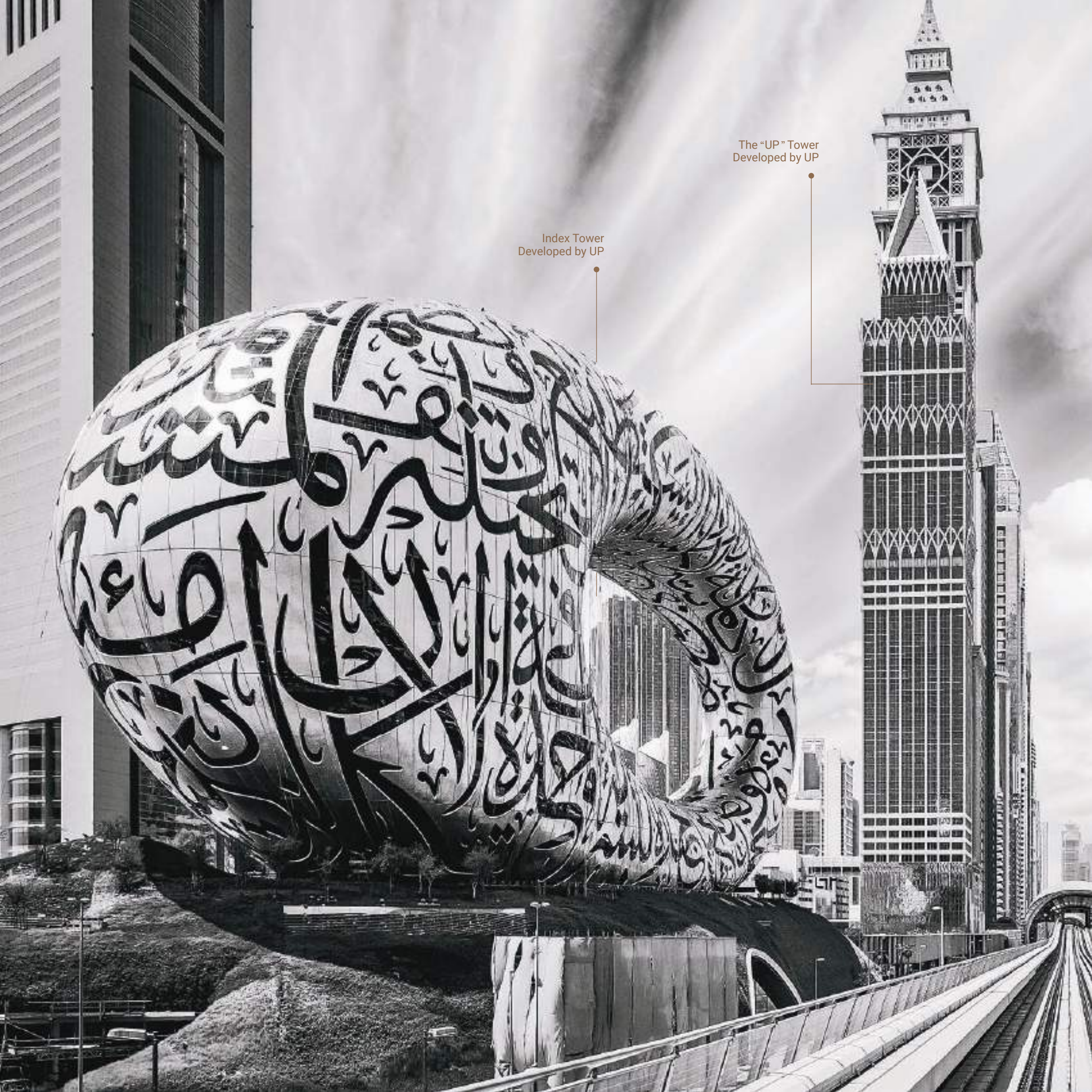
The "UP" Tower Developed by UP

دبي وجهة تجارية، خدمية وسياحية بامتياز، مما يجعل منها سوقاً عقارياً مزدهراً وتنافسياً مع عائدات مرتفعة على الإيجارات والاستثمار العقاري. إنها العنوان المثالي للاستثمار بهدف التأجير أو الشراء أيضاً للإقامة والعيش، فهي غنية بفرص العمل والمرافق المتعددة لتتعم بأسلوب حياة رائع وفريد.